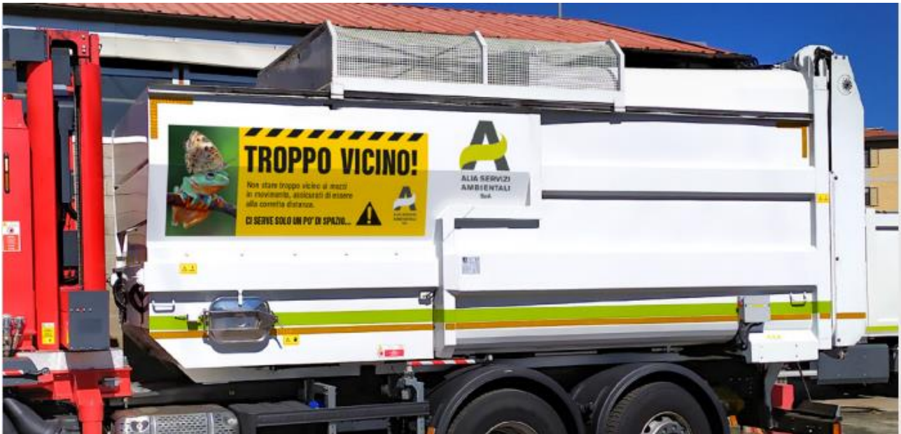
Adesivo lato sinistro (215 x 85 cm)