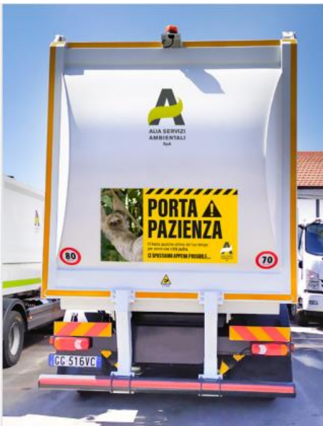
adesivo sul retro (170 x 90 cm)